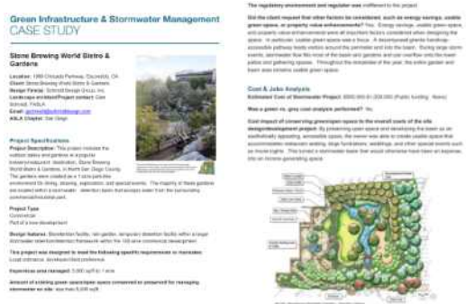
Figure 1. Example of Green Infrastructure Case Study Report by ASLA

기술되어 있다. 각 항목들은 미국조경가협회 내 전문가들이 조사한 것이다. 전체 479개의 사례 중 중복되는 사례를 제외하고 447개를 분석의 대상으로 하였다.