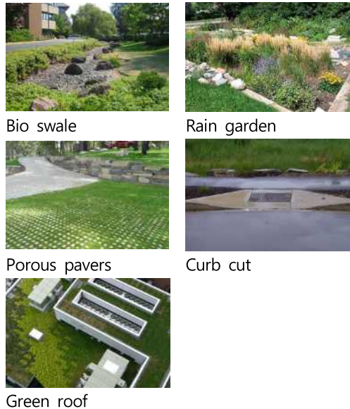
Figure 2. Type of Green Infrastructure

본 연구에서는 각 사례조사 보고서 중 적용된 그린인프라의 세부 기법(ASLA 보고서 내에서의 design feature)과 커뮤니티 편익(ASLA 보고서 내에서의 community & economic benefits) 항목을