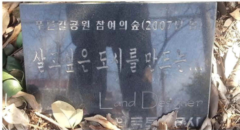
그림 8. 푸른길공원에서 참여의 숲 기념비 Figure 8. The monument of participation Forest on Pureungil Park

2015년부터 '광주광역시 도시공원 및 녹지 등에 관한 조례'가 마련되어 주민참여가 지속적으로 이루어질 수 있는 법적 장치와 공원 운영의 지원 체계가 마련되었다. 이런 제도 및 재정 지원이 마련되기 전에는 2004년에 시작된 광주광역시 100만 그루 헌수 운동으로 2007년 '푸른길공원 참여의 숲' 조성 지원을 받았다(그림 8 참조).