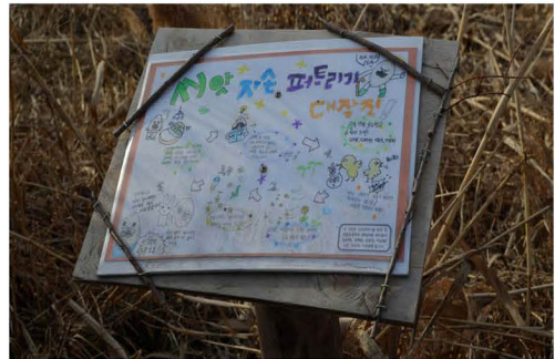
그림 4. 고덕수변생태공원의 주민참여로 만들어진 안내판

고덕수변공원 조성은 2003년에 서울특별시 계획으로 전문가 위주의 ‘행정(공공) 주도적’으로 시작되었다. 공원 계획 및 조성은 관(官) 주도의 전문가 집단으로 이루어졌고, 조성이 완료된 2005년부터는 2년 단위로 위탁기관을 공모와 심사를 거쳐 선정하