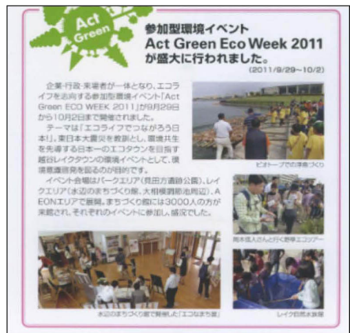
그림 14. 녹색 생태 주간 활동 2011 Figure 14. Act Green Eco Week 2011

레이크타운 택지 개발 지구에 인공적으로 조성된 호수 주변에 가로수 및 공원을 조성하고, 지역 환경단체가 지속적으로 도시공원 모니터링 및 관리를 실시하는 공동 참여형 주민참여를 활용하고 있었다. 민간기업, 행정, 주민이 함께 하는 이벤트 ‘Act Green Eco Week 2011’를 개최하여, 지역 주민과 시민환경단체와 함께 지역 및 미다카타 유적공원 투어, 수변 공원 만들기 체험 등 프로그램을 담고 있다(그림 14 참조). 택지 개발 및 공원 기획, 설계는 개발 주체인 독립 행정법인 ‘UR都市機構’에서 주택단지 입주 예정자들의 선호 요소와 여가패턴을