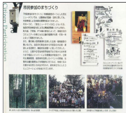
그림 10. 코호쿠 그린네트워크에서 주민참여 Figure 10. The case of Resident Participation on Kouhoku green network

공원 운영 및 관리에 있어서 주민참여는 ‘간접적 참여’, ‘협의적 참여’, ‘공동 참여’로 이루어지고 있다. 자연환경을 활용한 생물, 식물 관찰 모임 등 당