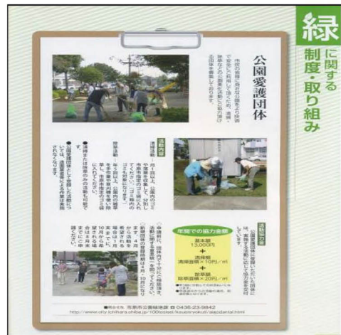
그림 12. 이치하라시 공원에호가 조직 Figure 12. the Park protection organizations of Ichihara city 출처 : Ichihara City Hall, 2013. Recommendation of greening

첫째, 이치하라시에서 도시공원 조성 설계와 시행은 행정과 전문가가 주도를 하지만 도시공원을 청결하게 유지하기 위해서 ‘공원에호가 단체’를 지원