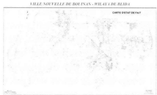
그림 3. 부이난 신도시 기존 취락지역의 분포 Fig. 3. Spatial distribution of existing communities in Bouinan

수도인 알제 인근에 위치한 부이난은 수도의 행정기능과 상업기능을 분담하고 양호한 고밀도 주거지역을 조성함으로써 수도의 과밀·확산 문제를 해결하는 신도시 가운데 하나로 2009년 설계되었다. 그러나 발주 후 약 1년이 지난 2010년 신도시 부지선정, 건설비용총당, 수도기능이전 측면에서 문제점이 나타났다. 애초 부이난 신도시는 기존 4개 취락지를 수용 개발하여 신도시의 주요 기능 중심지로 변모시킬 계획이었으나, 기존 취락지역의 수복보전 이슈가 대두하면서 도시골격과 성격이 전면적으로 변경되는 결과를 가져오게 되었다. 나아가 기존 취락지역 수복보전 문제는 개발비용의 총당문제와 결부되어 사업추진의 걸림돌이 되었다. 국내 건설업체들은 신도시에 조성되는 토지를 매각하여 개발비용을 총당하려는 자원조달계획을 수립하였으나, 기존 취락지역 보전으로 인해 자원조달이 어려워졌을 뿐만 아니라 기존 취락지역 정비를 위한 추가적 비