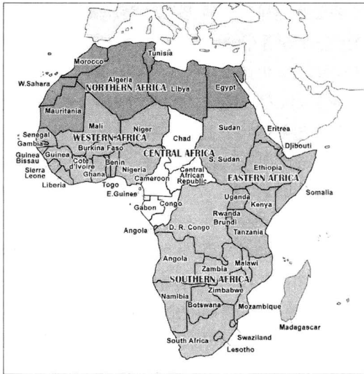
그림 1. 아프리카 국가들의 지리적 분포 Fig. 1. Geographic distribution of African countries

54개국에 있는 아프리카 대륙은 면적이 약 3,022만 km 2 , 인구는 11억 명(2014년 기준)으로 아시아 다음으로 면적이 넓고 인구가 많은 지역이다. 아프리카는 지리적으로 북측으로는 지중해, 북동측으로는 수에즈 운하와 홍해, 남동측으로는 인도양, 서측으로는 대서양으로 둘러싸여 있다.